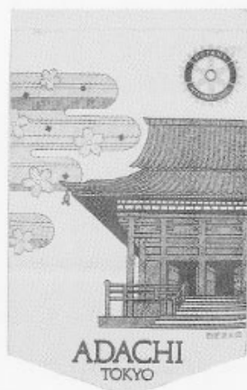
新・旧バナー交替