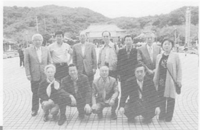
忠烈祠 MARTYRS SHRINE 2002.3.3.